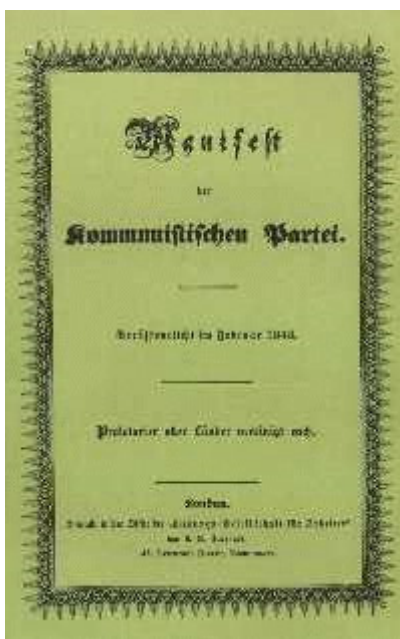
Обложка «Манифеста Коммунистической партии» издания 1848 года (выпуск на 30-ти страницах)

На место старого буржуазного общества с его классами и классовыми противоположностями приходит ассоциация, в которой свободное развитие каждого является условием свободного развития всех.